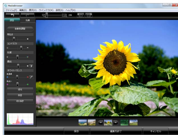
「MediaBrowser™」 Ver. 2.5 画面イメージ

今回、株式会社リコーのデジタルカメラ新モデル 「CX4」に付属することになりました。